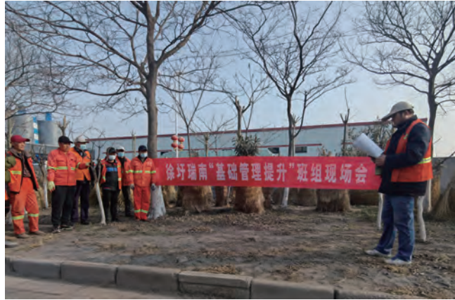
连日来,徐圩投资公司贯彻集团公司“基础管理提升年”工作部署,深入开展“基础管理提升进班组”行动,强化工作纪律执行,促进安全合格班组创建,开展节能降耗活动。(刘永)

抢抓发展机遇,培育壮大盐田玉品牌。不断提升“盐田玉”内涵,以品种为基础,以品质为核心、以品味为卖点,走“以精取胜、以质争优”的差异化发展路线。加大宣传推广力度,讲好“盐田玉”故事,注重品牌文化建设、多元化发展,提高“盐田玉”品牌知名度。打开线上线下销售渠道,制定切实可行的销售管理办法,积极拓宽销售渠道。市区巨龙路直营店投入运营,扩大市场占有率。推动车间升级改造,打造自动化、标准化、智能化“米工厂”。积极拓宽产品线,加大市场调研力度,提高市场布局准度,推进覆盖更广阔的用户圈。(青宣)