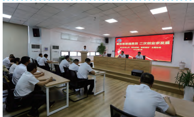
9月14日,徐圩投资公司党委举办“解放思想、提质增效”主题论坛,来自各基层单位的8名同志结合“大讨论”学习情况和工作实际,聚焦“形势怎么看、问题怎么办、发展怎么干”主题主线,谈体会、说问题、讲转变。围绕如何强化生产经营、挖潜增效、市场开拓等方面新举措、新方法,积极作为、献计献策。(陈健)