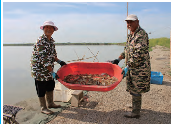
“双节”期间，青口投资公司近2万亩养殖池塘水产品正在大量起捕上市，秋天肥美的梭子蟹、对虾成为假期当仁不让的“硬菜”。(尤冬冬)

▲为扎实推进安全生产百日攻坚专项行动，华茂绿化工程公司组织安全管理人员、一线班组长、职工代表参加“安全生产大家谈”活动，为提升公司安全管理质效建言献策。(颜涵)