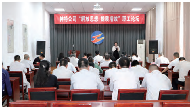
日前,神特新材料公司举办“解放思想、提质增效”职工论坛,7名参赛选手紧扣“聚焦‘双二零’,我来做贡献”演讲主题,以解放思想引领观念大更新、作风大转变,联系本岗本职,当好先锋表率,发表真知灼见,破解发展难题。(神特宣)

围绕中心任务,重点项目建设稳扎稳打。统筹推进集团棚户区项目裕源三期土建设施工,确保年内主体工程具备验收条件。高标准推进自贸区国际医药创新产业园二期项目建设,确保年内完成主体12层施工任务。在做好项目建设的同时,探索“专业招商+大众信息”新模式,坚决扛起园区招商主体责任。上元公司切实抓好“供产销”等重点环节,加大产品研发力度,拓宽产品市场营销模式,扎实推进“降本增效”,最大限度释放创效能力。(顾卫远)