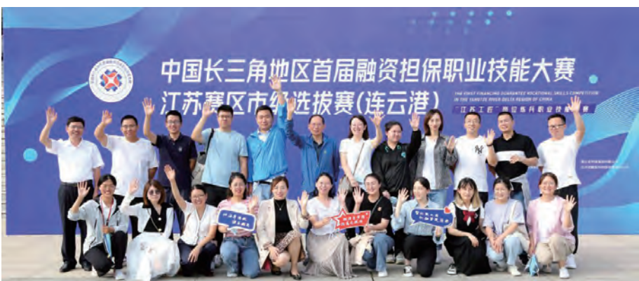
9月17日,格斯达公司作为我市重要政府性担保机构,派出23名业务骨干参加由长三角地区三省一市总工会、江苏省信用再担保集团联合举办的中国长三角地区首届融资担保职业技能大赛江苏赛区市桥选拔赛(连云港)。该项赛事已列入江苏省人社厅“江苏工匠”岗位练兵职业技能竞赛活动省级一类竞赛。(陆丽婷)

司24小时值班值守,确保通讯畅通。严格遵守防台指挥部制定的工作计划,出动环卫工人330余人次、车辆23台次,排查公交站台、广告灯箱、隔离护栏等环境卫生设施。组建绿化抢险突击队,对辖区内高大树木、新栽树木的支撑进行排查和加固。组织生产安全部门对创智绿园、昌圩湖公园、久和小游园的健身设备进行拉网式排查,确保设备完好,安全运行。(张永静)