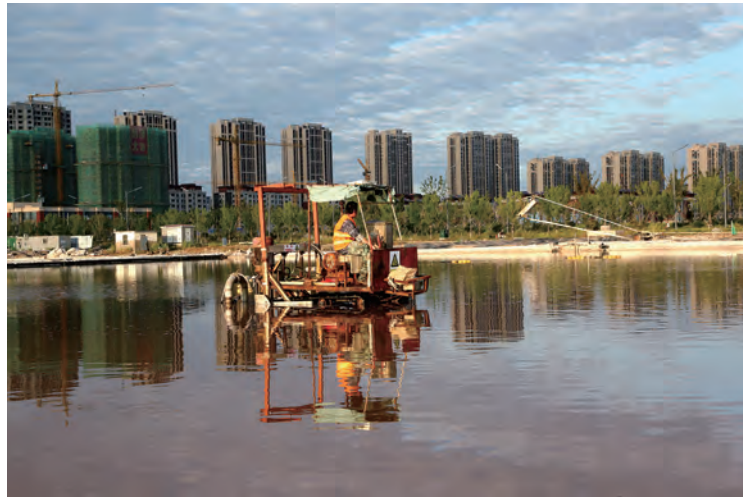
9月17日，台北投资公司秋季扒盐正式拉开序幕，预计本次扒盐历时60余天，在保证安全、质量双过硬的前提下，预计扒盐量1.5万吨。(苏玲)