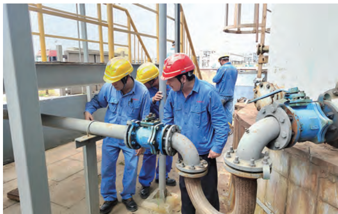
为进一步加强国庆期间安全生产工作，为党的二十大胜利召开创造良好的安全生产环境，9月10日以来，利海化工公司持续开展安全检查和重大危险源专项检查督导，共查出隐患整改项目46项，并按照规定时间逐一完成整改。(林涛)

突出和谐创建，营造人心向企、稳定发展新格局。深化产改工作，搭建职工教育平台，多渠道组织岗位技能培训；落实民生实事办理清单，解决职工实际困难；开展“喜迎二十大”职工文化娱乐活动，不断增强企业凝聚力，提升职工的幸福指数。全面完成集团公司下达各项目标任务，以优异的成绩向党的二十大献礼！(金航宣)