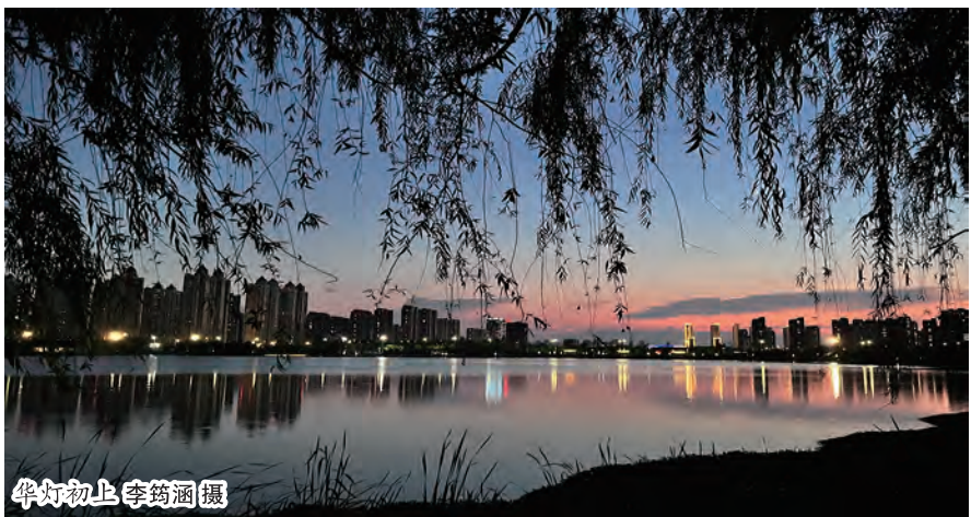
华灯初上