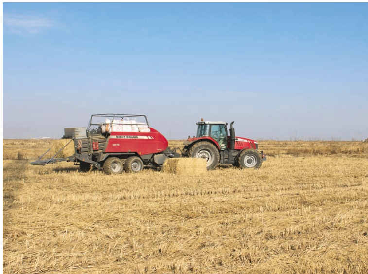
当前,青口投资公司早计划、早安排、早落实,迅速掀起“冬准”农业生产高潮。该公司通过与秸秆利用专业合作社合作,对农田收割后的秸秆进行机械清理,并对秸秆清理结束后的农田采取适宜的翻耕方式进行土地翻耕,目前已顺利翻耕3300余亩。(仲伟彬)