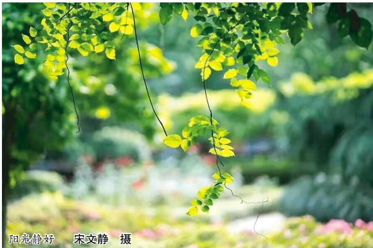
阳光静好

需要指出的是,新中国成立初始,两淮盐务局更加严厉地打击贩私行为,颁布了《淮盐缉私暂行办法》、《私盐查缉处理暂行办法》。1987年江苏省人民政府颁布《盐政管理办法》及《江苏省盐业管理条例实施办法》。对贩私行为的查处作出了更加务实、有效的规定。1995年,国务院发布《食盐专营办法》,从产、运、销等各方面对盐业管理作出详细规定。规范了流通秩序,维护了食盐营销,加大了执法力度,从2017年元月起,全国的食盐市场已全面放开。因为有了前期盐政的良好基础,可以相信,全国人民一定会吃上安全盐、放心盐。淮北盐场的历史功绩也将载入史册。